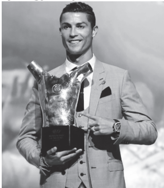
A tavalyi nyertes Cristiano Ronaldo eddig háromszor kapta meg az Európai Labdarúgó-szövetség díját

A végeredményt augusztus 30-án Monte-Carlóban, a BL-csoportkör sorsolásán hirdetik ki.